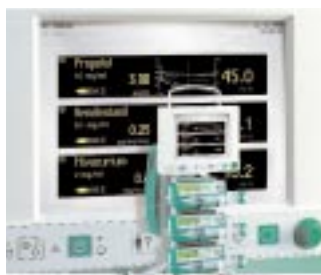
fm anaesthesia Der Arbeitsplatz für die intravenöse Anästhesie