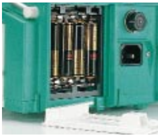
Einfacher Wechsel der Batterien auf der Station, optimierte Verfügbarkeit. Verwendung quecksilber- und cadmiumfreier Batterien.