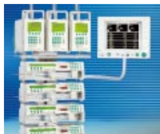
fm intensive Der Arbeitsplatz für die Intensivtherapie

Sprechen Sie mit uns über individuelle Arbeitsplatz-Lösungen. Wir beraten Sie gern!