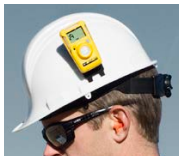
Clip für Schutzhelm