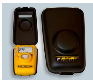
Gehäuse für Ruhezustand